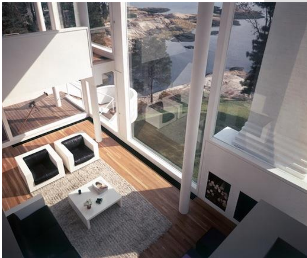
▲史密斯住宅（The Smith House）

到了 1970 年，Richard Meier 和理念相同的 Micheal Graves、Charles G Hejduk 組成「紐約五人組」，他們的作品有一個相同的特點，既便白，有著現代主義雕塑風格，因此他們亦被稱為白派（White）。