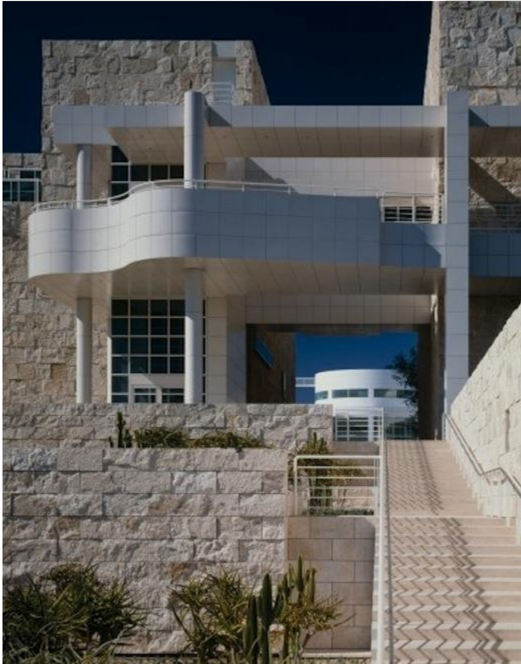
格蒂中心坐落於洛杉磯，是一個集展覽、研究、行政於一體的建築 中可以看到幾乎所有 Richard Meier 個性化手法，堪稱邁耶設計生涯